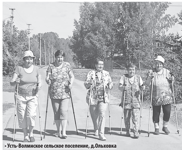
• Усть-Волмское сельское поселение, д. Ольховка