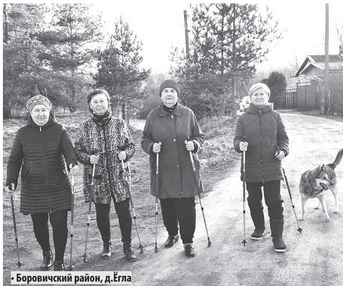
• Боровичский район, д. Егла