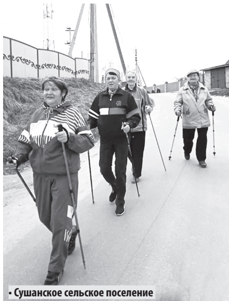
• Сушанское сельское поселение